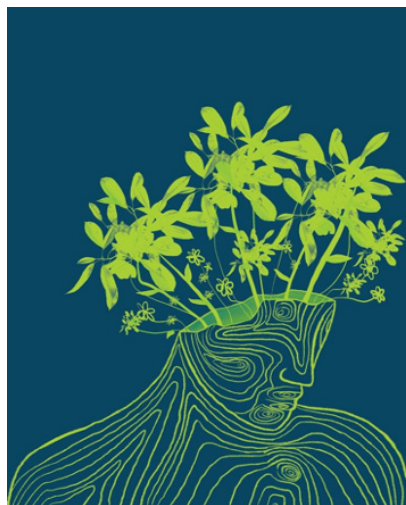
Figura n. 1 – Copertina Report RUS 2021